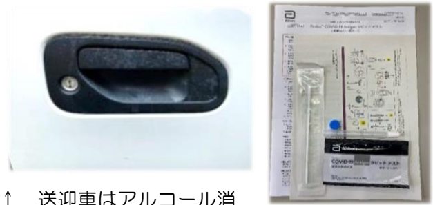
↑ 送迎車はアルコール消毒の跡でべったり…。 ↑ 抗原検査キット

全国的に新型コロナウイルスの感染者が急増し、第7波が顕著になったこの夏、伏見工房でも体調を崩される方や、濃厚接触到に該当される方が数名と、コロナをより身近に感じました。一時、クラスターになり、一部を閉めての活動、また在宅支援を選ばれる方もおられたりと、工房からにぎやかさが消え寂しく感じました。。 抗原検査キットも足りなくなり、どうしようと思いましたが他工房のご協力をえられ本当にありがたかったです。今もなかなか感染が落ち着かず二転三転の日々ですが、引き続き出来る範囲で気をつけていきます。