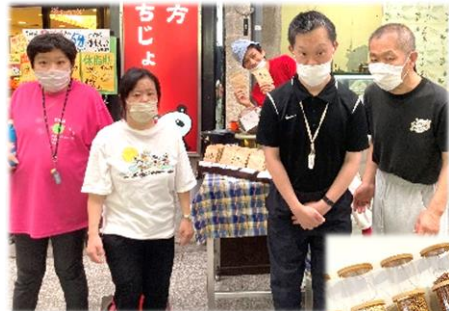
↑7月に行った 出町榎形商店街

『あくびコーヒー』様は出町柳榎形商店街と ZEROWESTKYOTO の2か所で販売されています。よろしければお立ち寄りください。