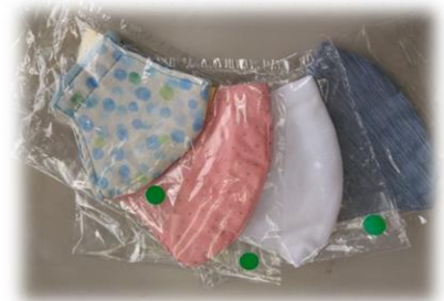
色とりどりのマスクです。 夏には、涼しい冷感マスクも ラインナップに♪