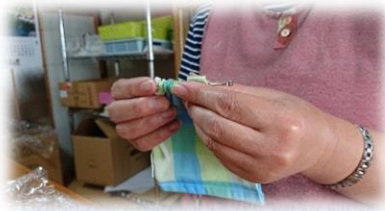
マスクにゴム紐を通していき す(*´ε`*)

伏見工房では型紙を使い、生地を切り出すところから加工を行い、布マスクを作っています。形は立体型、角型、サイズは大小2種類を取り扱っており、みんなで力を合わせて一つ一つ手作業で行っています。お近くにお立ち寄りになられた際は、お手にとって頂けると嬉しいです。