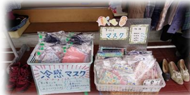
たんぽぽショップにて販売し ております(^o^)