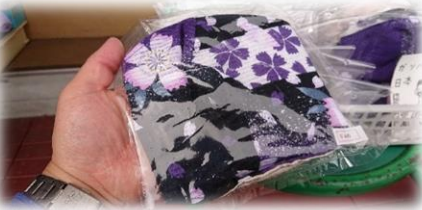
きれいな柄ですね(*^^*)