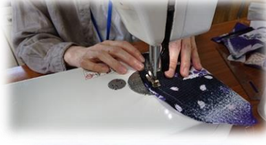
ミシンがけもひとつひとつ 丁寧にしていきます☆